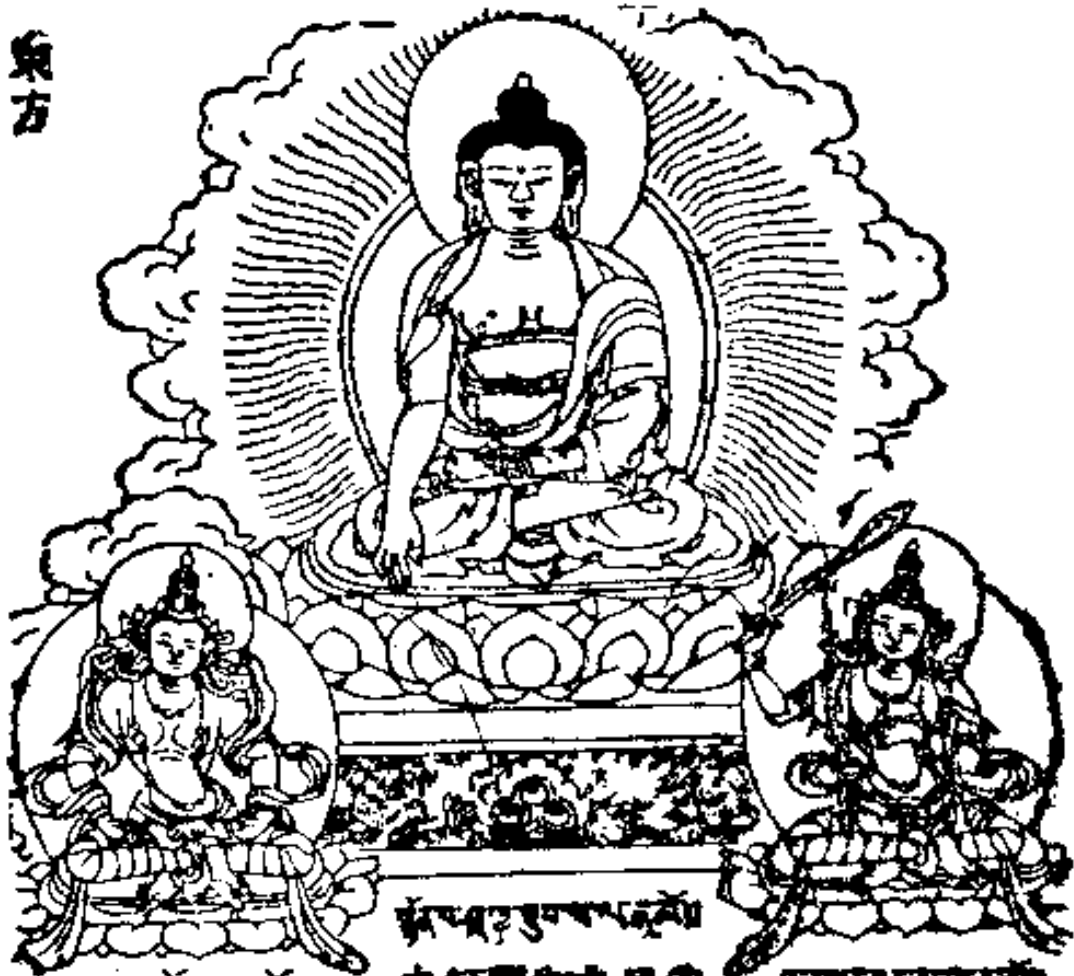
釋迦牟尼佛 救脫菩薩